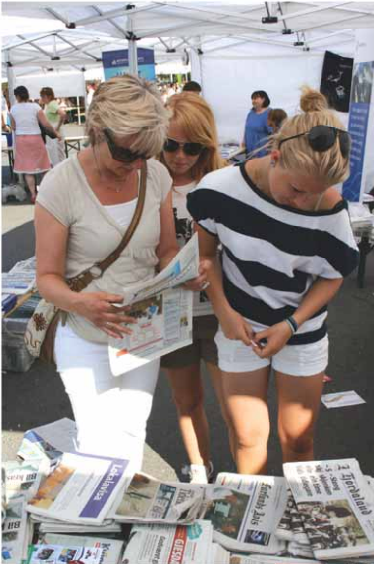
Avistellet med over 100 forskjellige aviser fra hele landet ble flittig besøkt.