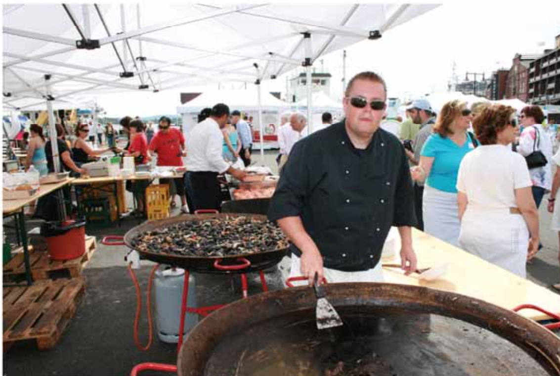
Paela og blåskjell gikk unna i solvarmen. Og varmt ble det for kokken.

Havforskningsinstituttet benyttet også fartøyet i forbindelse med barnesatsningen under arrangementet.