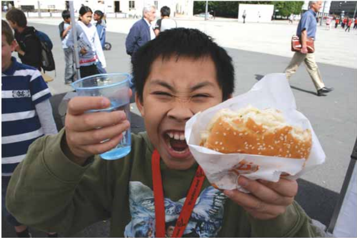
Lakseburger – det "ruler". Lakseproduktene var suksess.